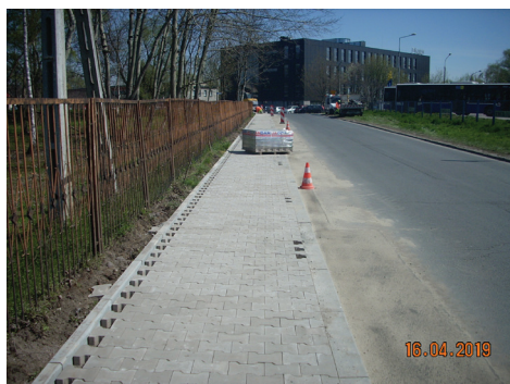
▲ Remont chodnika – ul. Na Załęczu