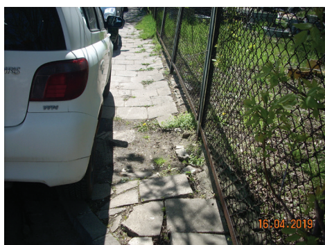
▲ Ul. Śliwkowa przed remontem

Do końca kwietnia br. zostanie opracowana dokumentacja na przebudowę ul. Strumyk (na odcinku od ul. Dolnomłyńskiej do ul. Poleskiej) i w tym roku nastąpi I etap realizacji tego zadania na łączną kwotę 300 000 złotych. Zakończenie całości prac jest planowane w roku 2020 roku.