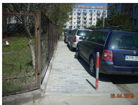
▲ Ul. Śliwkowa po remoncie