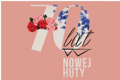
Identyfikacja wizualna obchodów 70-lecia Nowej Huty autorstwa Jagody Peceli.

Jest rok 1949, zapada decyzja o budowie nowego miasta na terenach Mogiły. Tak właśnie 70 lat temu rozpoczęła się historia Nowej Huty. Dwa lata później Nowa Huta stała się częścią Krakowa, a od roku 1990 w wyniku nowego podziału administracyjnego Krakowa jest obszarem, który obejmuje pięć dzielnic i zajmuje około 1/3 powierzchni Krakowa. Urbanistycznie Nowa Huta jest największą miejską kreacją przestrzenną okresu powojennego i została tak zbudowana, aby zapewnić jej mieszkańcom dobre warunki mieszkaniowe. Tutaj od lat żyją, mieszkają i pracują ludzie szczerze zaangażowani w życie swojej dzielnicy, którzy wspólnie z władzami naszego grodu opracowali wielowątkowy program obchodów jubileuszu 70-lecia Nowej Huty. Z tej okazji powstało kilka projektów infrastrukturalnych m.in. program remontu „70 ulic na