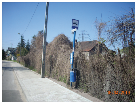
▲ Wyremontowany przystanek Szafranska