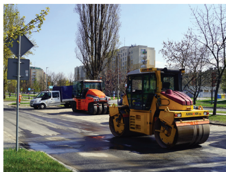
▲ Remont ul. Kłosowskiego

W roku 2019 postanowiliśmy także wymienić trzy nasze tablice informacyjne przy ul. Stella-Sawickiego, Tuwima oraz przy Biedronce na os. 2 Pułku Lotniczego w pobliżu Szkoły Podstawowej nr 155. Podczas wakacji zaplanowaliśmy remonty w czyżyńskich przedszkolach samorządowych – doprowadzenie ciepłej wody użytkowej i związane z tym faktem przeróbki instalacji oraz kotłowni. W szkołach z kolei będzie kończona wentylacja i wykonywane inne prace remontowe, o których napiszemy w następnym biuletynie.