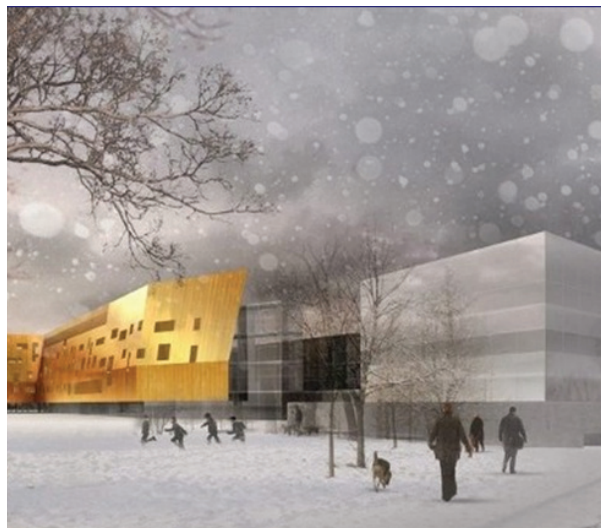
▲ Wizualizacja planowanego Centrum Obsługi Inwestora przy ul. Centralnej.