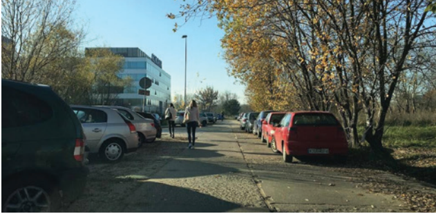
Fot. Grzegorz Michalski