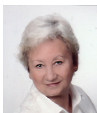
Przewodnicząca Rady i Zarządu Dzielnicy XIV Czyżyny