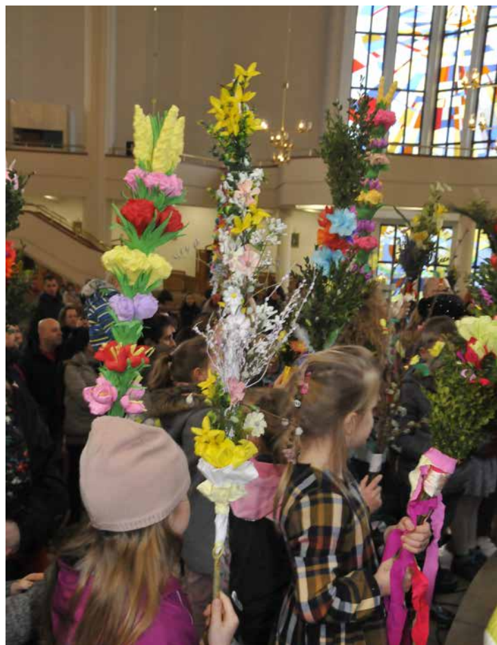
Konkurs Palm Wielkanocnych w Parafii Brata Alberta

2 kwietnia 2023 roku, po niedzielnych sumach, w czyżyńskich parafiach, odbył się Konkurs Palm Wielkanocnych.